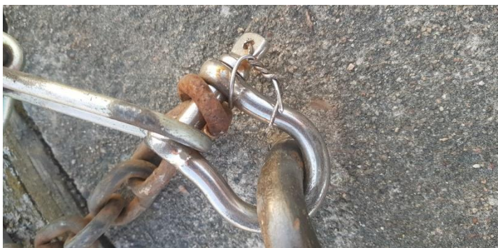
Bild 3. Säkring av schackel mot ofrivillig uppgängning.